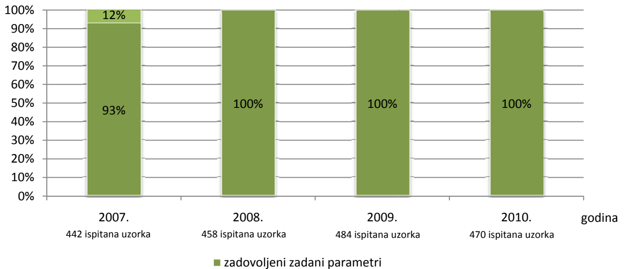
GRAFIKON 2: Usporedba rezultata ispitivanja laboratorija PRJ Kanalizacija za razdoblje od 2007. do 2010.

U 2010. godini oba su laboratorija ukupno ispitala 470 uzorka otpadnih voda. Svi ispitani uzorci pročišćenih otpadnih voda zadovoljavali su zadane parametre odnosno nisu prelazili maksimalno dopuštene vrijednosti.