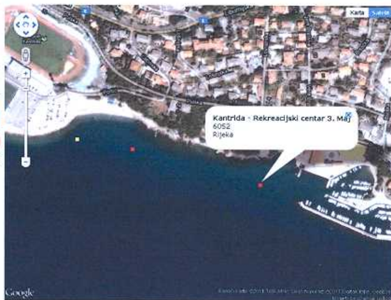
Slika 2. Kartografski prikaz ispitivnja kakvoće mora na području zapadnog dijela Rijeke (Kantrida – Rekreatijski centar "3. MAJ")